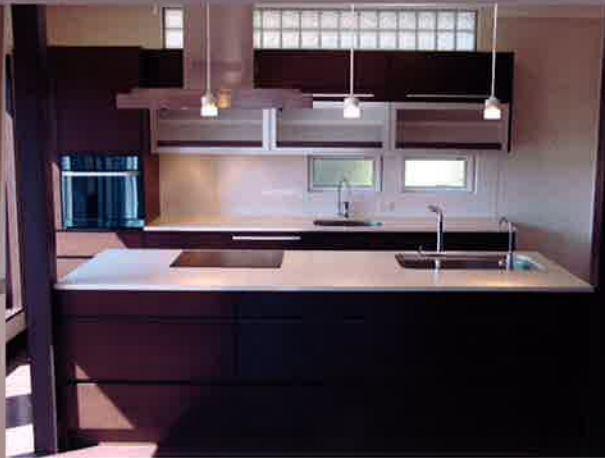
オリジナルキッチンをはじめとする住まいの設備